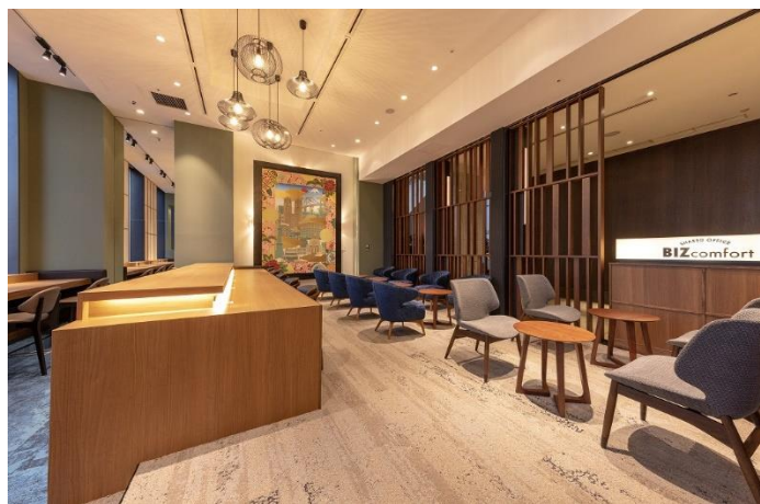
BIZcomfort ザ ロイヤルパークホテル アイコニック 東京汐留 イメージ

東京都港区東新橋に『BIZcomfort (ビズコンフォート) ザ ロイヤルパークホテル アイコニック 東京汐留』をオープン致します。 ザ ロイヤルパークホテル アイコニック 東京汐留の24Fに位置します。