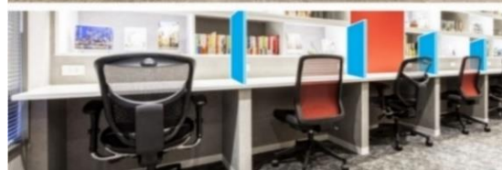
感染症対策 イメージ