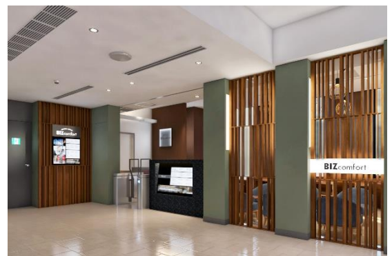
施設入口 イメージ

BIZcomfortは全国90拠点以上のコワーキングスペースを展開中。すべての拠点が使える「全拠点プラン」等もあるため、当施設のオープンは新規顧客だけでなく、現会員への新たな働く場所や価値の提供にもつながると考えます。